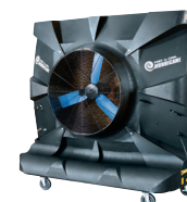
Montana® V2 Hurricane