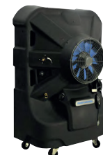
Montana® V2 Jetstream