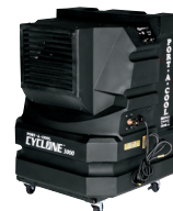
Montana V2 cyclone