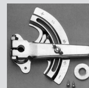
Clés pour volet conjugués